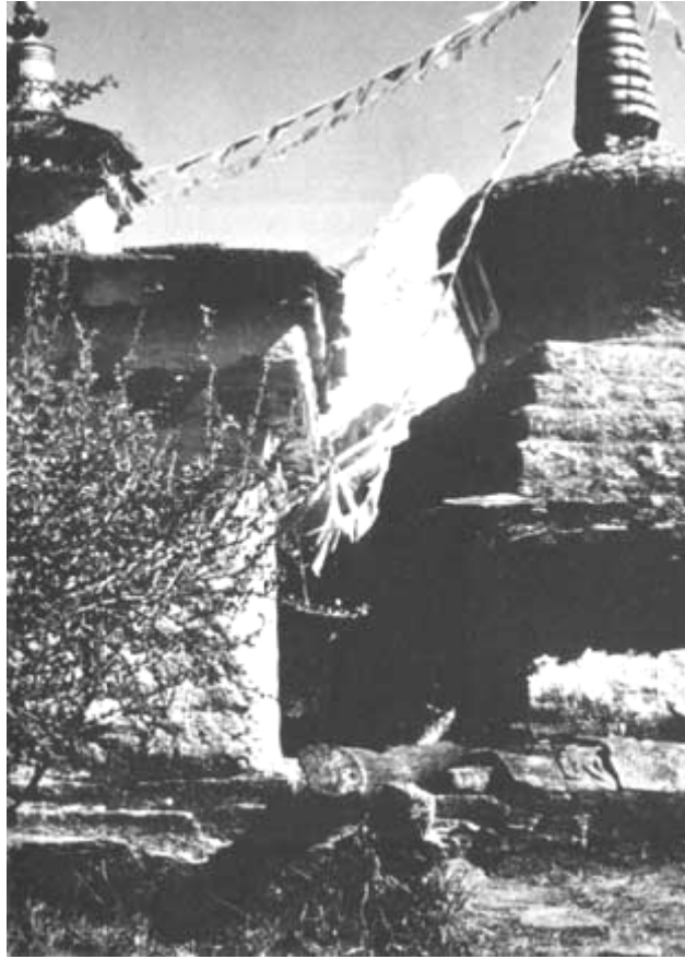
Village de Thyangboche